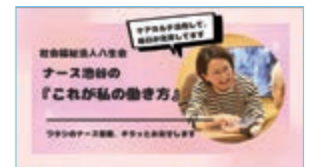
発表作品はケアカルテの ホームページ上に掲載!!