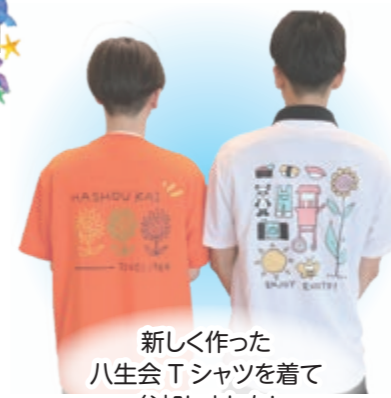
新しく作った 八生会Tシャツを着て 参加しました!

もうひとり、参加していた職員のお子さんに感想を聞いてみると元気に「楽しかった～」と答えてくれ、砂浜に登るだけで疲れ切っていた企画担当の疲れが一気に吹き飛びました。会食では「つぼ漬けカルビ」と「釜炊きごはん」が一番人気で、まるで肉フェスかというくらいみんなでモリモリ食べました。