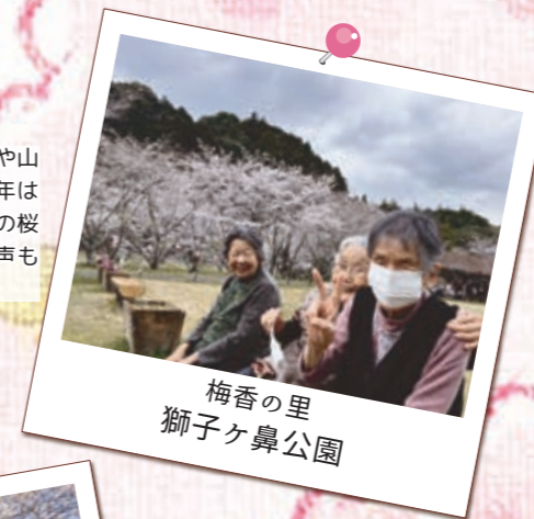
梅香の里 獅子ヶ鼻公園

敷地川沿いに咲くソメイヨシノや山桜の桜並木を楽しみました。今年は雨も多かったですが「雨上がりの桜も風情があって良いな」という声も聞かれました。