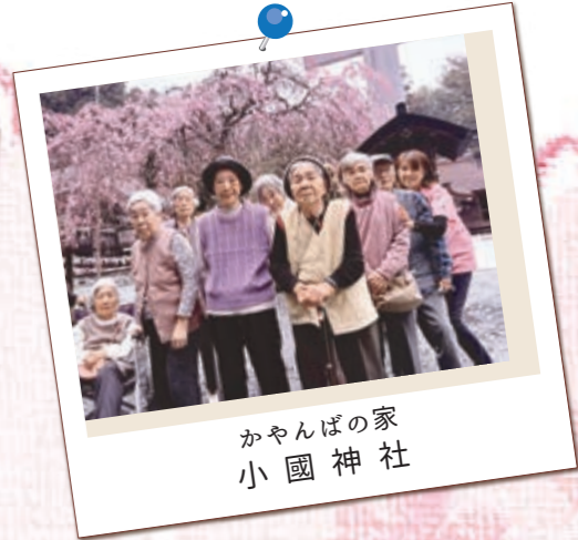
かやんばの家 小國神社