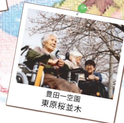
豊田一空園 東原桜並木

一空園のすぐ西には安間川堤防の桜並木、豊田一空園のすぐ東には東原桜並木があります。あたたかい日には桜並木のお散歩を楽しんでいます。「気持ちいいね〜」「きれいだね〜」と嬉しそうな声が聞こえます!