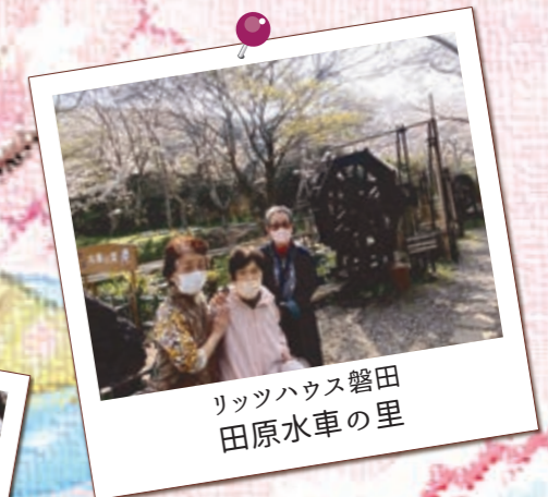
リッツハウス磐田 田原水車の里

「こんなところにも水車があるんだね〜、初めてきたよ!」「桜もきれいだね!」と、びっくりされていました。人混みもなく、ここは穴場です!