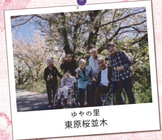
ゆやの里 東原桜並木

敷地川沿いに咲くソメイヨシノや山桜の桜並木を楽しみました。今年は雨も多かったですが「雨上がりの桜も風情があって良いな」という声も聞かれました。