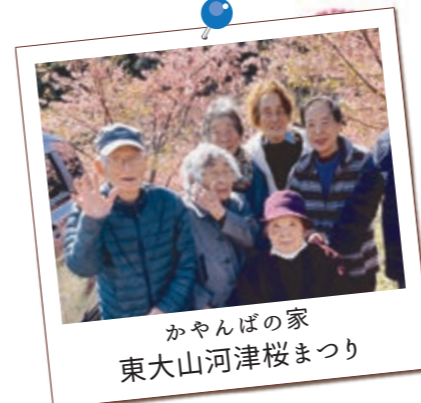
かやんばの家 東大山河津桜まつり

春の風にゆられながら、みんなでのんびりお花見を楽しみました。 やわらかな日ざしの下で、おしゃべりしたり、お買い物を楽しんだり… ゆっくり過ごすだけで、心がふわっと軽くなるようなひとときでしたね。