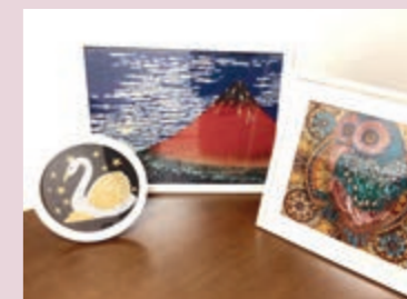
ダイヤモンドペインティング