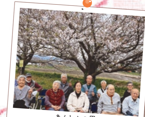
あんしんの里 新堀桜並木

東大山河津桜は河津桜と菜の花のコラボレーションを楽しむことができます。駐車場からは桜並木と菜の花畑が一望できます。とっても素敵な景色を見ることができました!