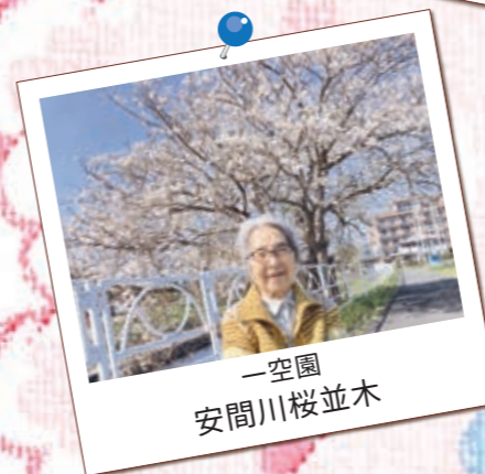
一空園 安間川桜並木

一空園のすぐ西には安間川堤防の桜並木、豊田一空園のすぐ東には東原桜並木があります。あたたかい日には桜並木のお散歩を楽しんでいます。「気持ちいいね〜」「きれいだね〜」と嬉しそうな声が聞こえます!