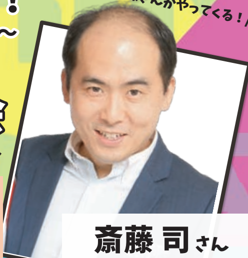
斎藤 司 さん トレンドィエンジェル

同期の「たかし」と2004年、漫才コンビ「トレンドィエンジェル」を結成。2013年「オンパト+」3代目チャンプ、2014年「THE MANZAI」準優勝、2015年「M-1GP」王者。元サラリーマンである斎藤ゆえにわかる職場やプライベートでのポジティブシンキングやモチベーションアップ術を伝授します。