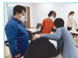
ボディメカニクス