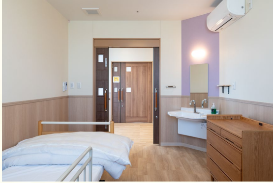
ユニット型個室80室