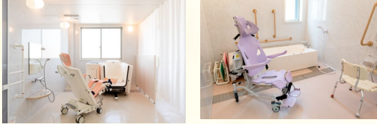
ご利用者の状態にあった快適な入浴