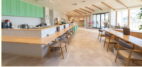
café & bakery SORA

2023年3月に新設された施設です。 全室個室での対応により、ご利用者一人一人の想いを汲み取り、その方らしさに寄り添ったケアを目指します。