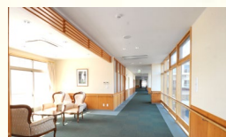
セミパブリックスペース