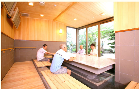
いつでも使える足湯（要予約）